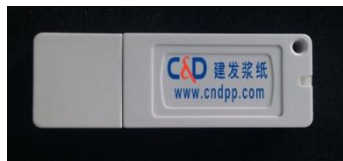
图 1：飞天诚信 USB-KEY

客户在数字签名时需要使用含有数字证书的飞天诚信 USB-KEY，外观如图 1 所示：