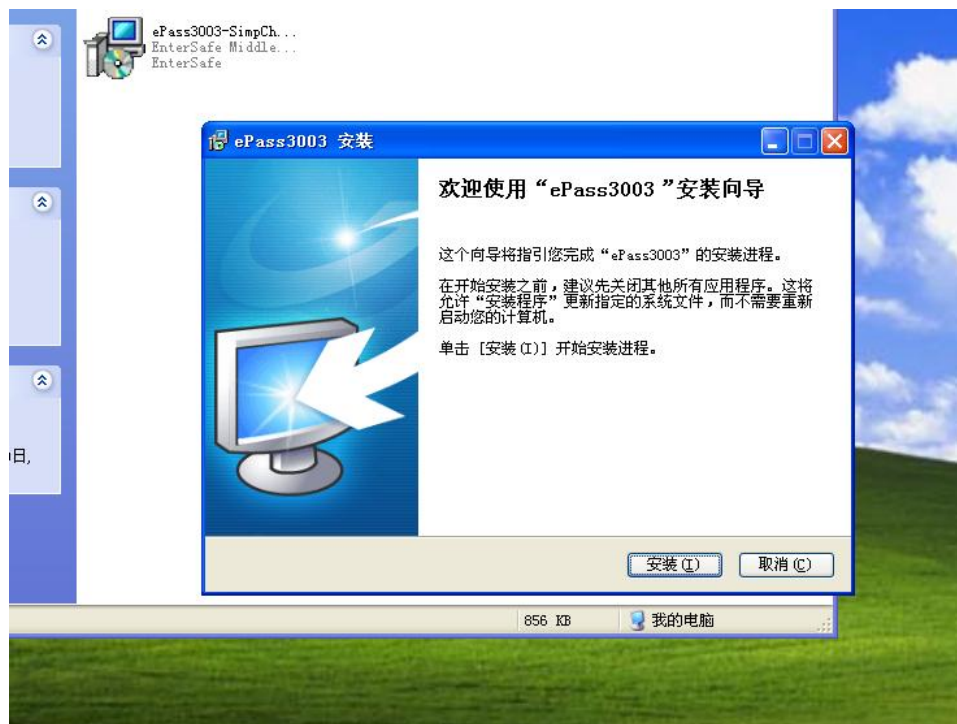
图 2：驱动程序安装界面

插上 USB-KEY，运行下载的“数字证书管理工具”安装包，安装 USB-KEY 的驱动程序（EnterSafe ePass3003），点击安装即可进行安装。如图 2：